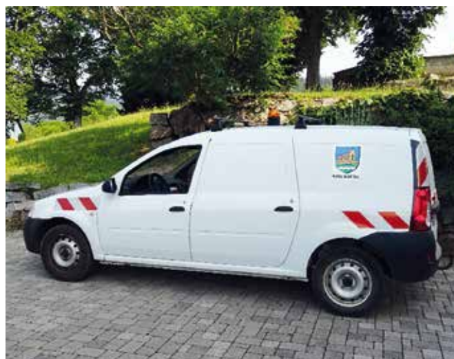
Remplacement du véhicule Dacia ...