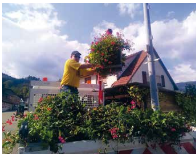
Installation d'un bras sur le plateau du camion benne très utile pour le décrochage des vasques.