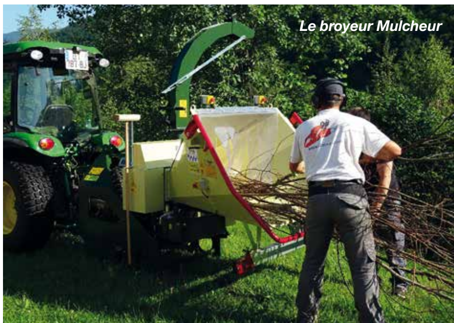
Le broyeur Mulcheur