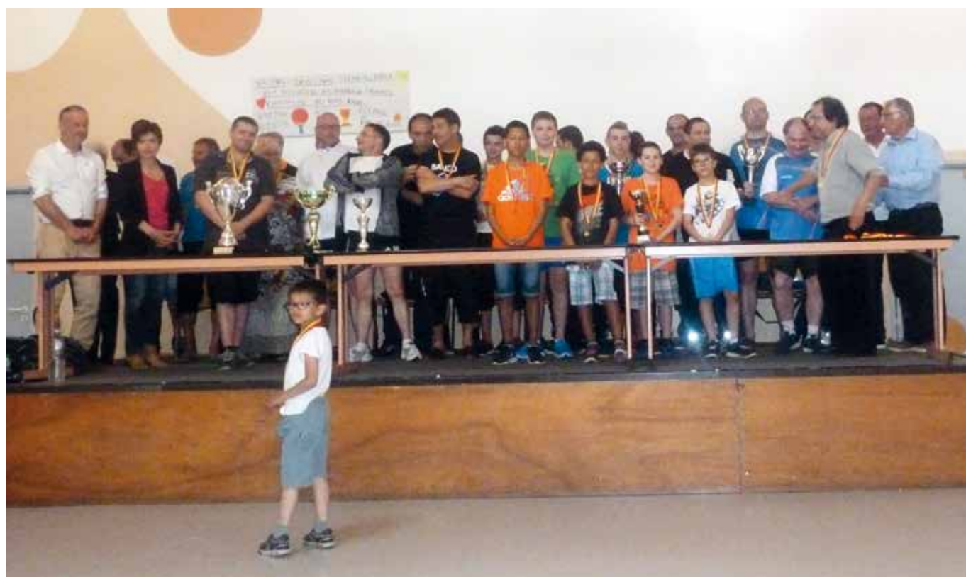
Tous les participants et officiels après le remise des prix d'un tournoi interne

Contacts : Denis GASSER au 06 10 78 12 06 ou Pascal GASSER au 03 89 38 81 46