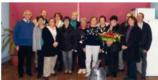
Remise des prix pour les lauréats.