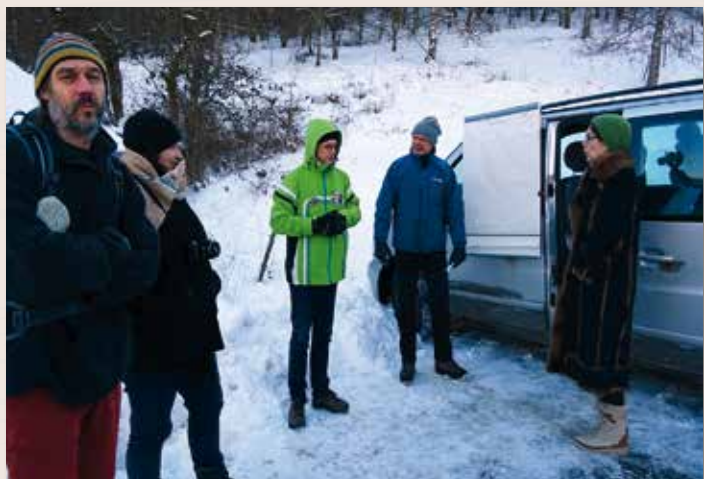
Rencontre sur le terrain (rue Hecken) dans le cadre du P.L.U.i.