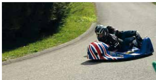
Les side-cars toujours aussi acrobatiques !