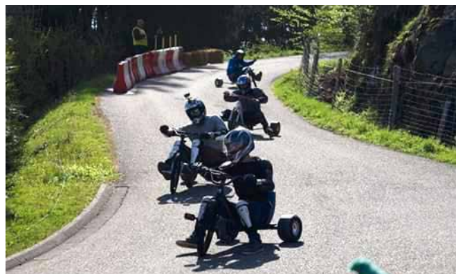
Les drift trike