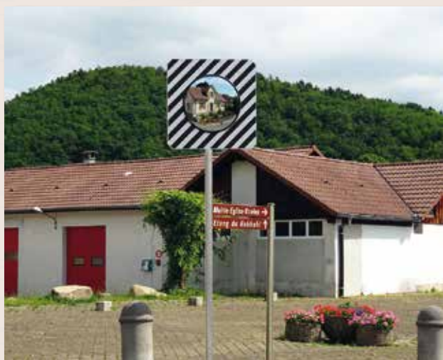
Sécurité renforcée au carrefour par la pose d'un miroir.