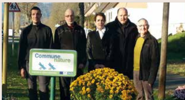
Commune nature : objectif atteint avec les 2 libellules « Pas de Pesticide - Plus de vie ».