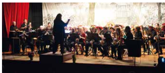
Concert annuel au foyer rural de Rougemont le samedi 6 mai 2017