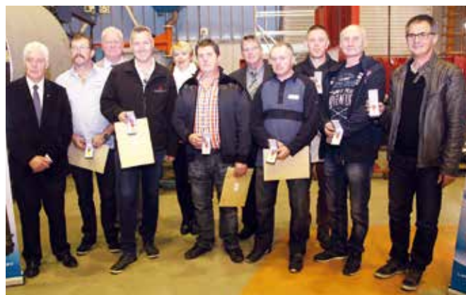
Les médaillés avec la direction et les élus