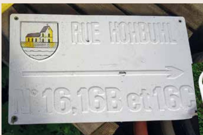
La signalétique au cœur du village a retrouvé tout son éclat.