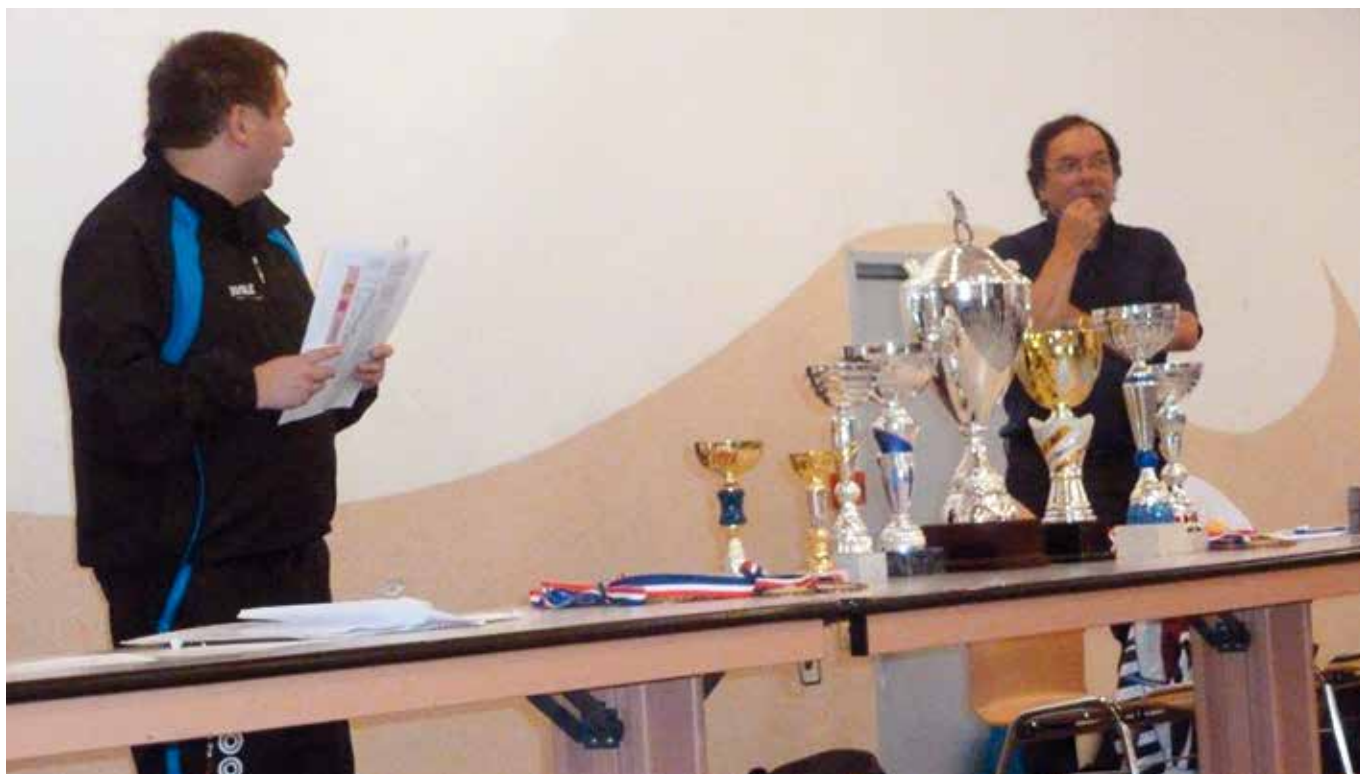
Les 2 présidents lors de la remise des prix d'un tournoi interne

N otre association «CLUB PONGISTE DE LA HAUTE DOLLER» regroupant les sections Tennis de Table de Kirchberg, Wegscheid et Masevaux/Niederbruck se porte très bien et compte 45 licenciés actuellement.