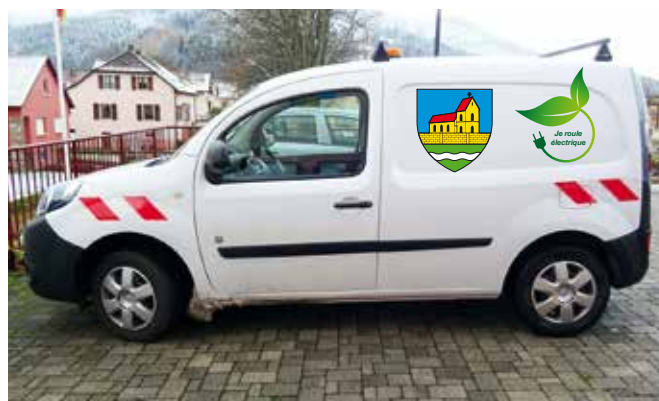
... par un véhicule électrique Kangoo.