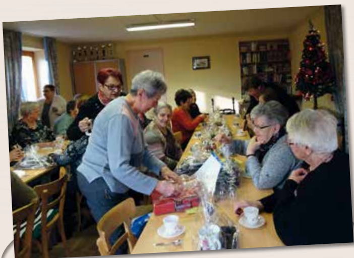
Le club de l'amitié fête Noël.