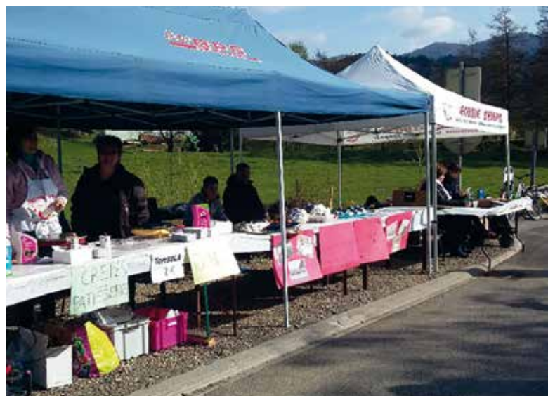
Le stand de pâtisseries