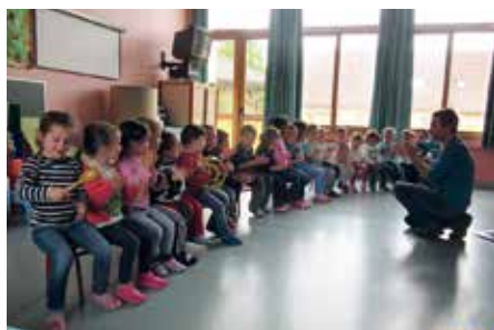
Animation à l'école maternelle de Kirchberg Wegscheid par des intervenants de l'école de musique le 11 mai 2017