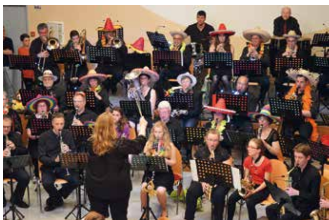
Concert dîner-dansant samedi 29/04/2017 à la Maison de Pays sur le thème du voyage