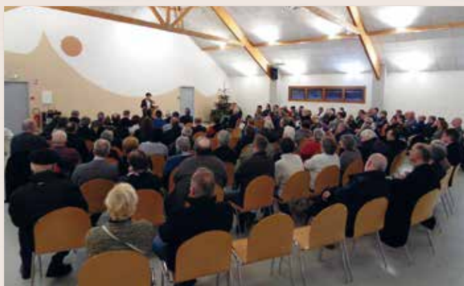
Cérémonie des vœux du 7 Janvier à la Maison de Pays.