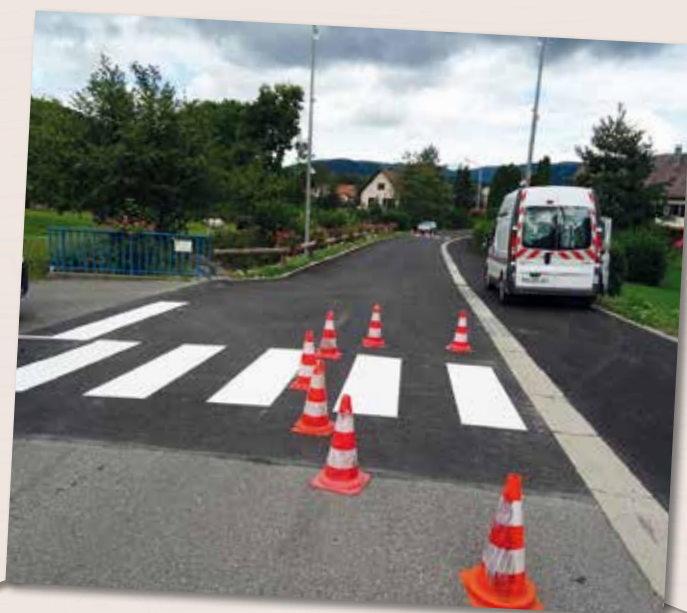
Dernière étape rue Gassel avec la réalisation des passages piétonniers.