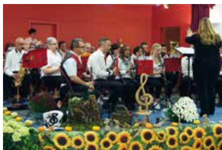
Concert à Champagny dimanche 22 octobre 2017