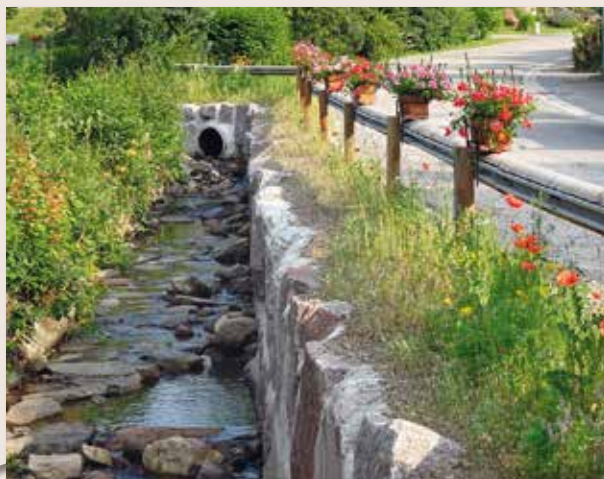
Après les travaux d'enrochement, jachère fleurie le long du ruisseau.