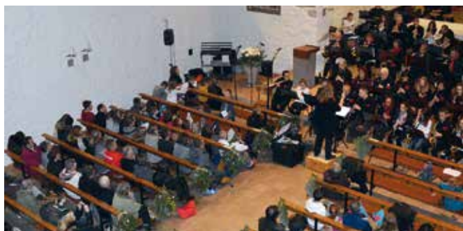
Concert de Noël à l'église de Kirchberg Wegscheid le 3 décembre 2016