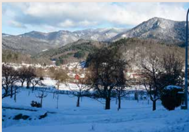
1 ère semaine de Janvier et son manteau neigeux. Superbe !