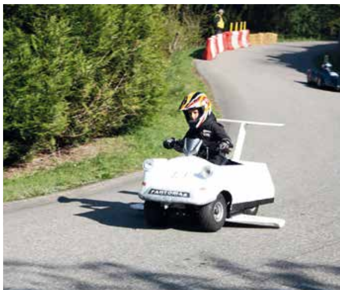
Drôle de petit fantôme !